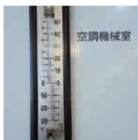
空調機械室入口前 21^{\circ}\text{C}

機械室入口前に設置された温度計は 21^{\circ}\text{C} 、スイッチ内のセンサーは 22^{\circ}\text{C} 。室内実測値との差はほぼありませんでした。