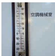
空調機械室入口前 21^{\circ}\text{C}

機械室入口前に設置された温度計は 21^{\circ}\text{C} 、スイッチ内のセンサーは 22^{\circ}\text{C} 。室内実測値との差はほぼありませんでした。