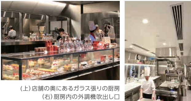
(上) 店舗の奥にあるガラス張りの厨房 (右) 厨房内の外調機吹出し口

「八日市の杜」の厨房は店舗内にあり、ルーフトップ外調機(クリーンエア仕様)から供給される新鮮外気で陽圧を保ちながら、外部からの空気の侵入を防いでいます。「お店は人の出入りがある工場のような完全密封ができません。そのため給排気バランスにはとても気を使います。粉を扱う現場では集塵機や換気扇が常に稼働していて排気が多い。導入当初からチューニングを繰り返して、今は外調機(RFT-COA)を使いこなせていると感じています。」小野林シェフのこだわりは、温湿度管理や空気の流れにまで及びます。