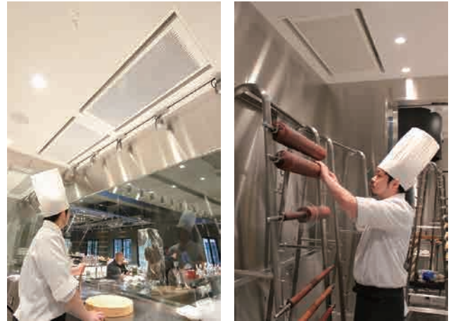
焼きあがったバームクーヘンにもやさしい空調

風を感じない空調でやさしく保存されたバームクーヘン。味わいの裏側にある細やかな気配りを感じます。