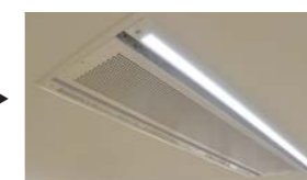
天井埋め込み形エアコン + 環境エアビーム