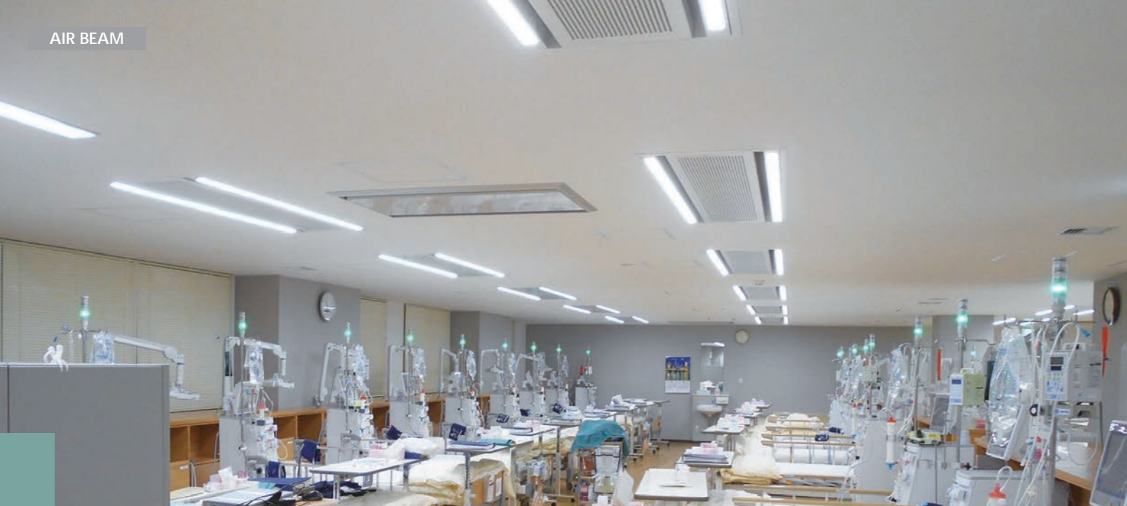
医療法人 寿会新栄クリニック様