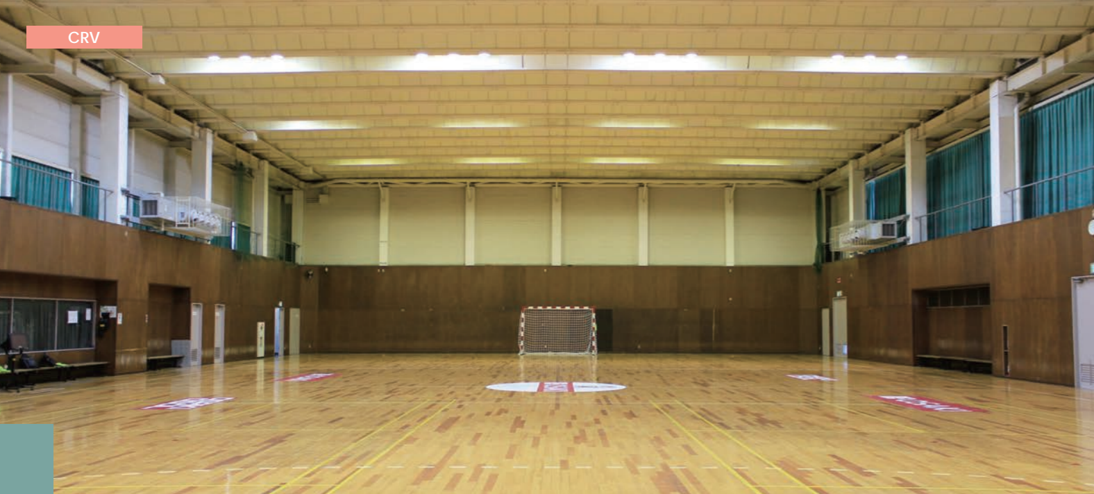
大崎電気工業株式会社 埼玉事業所様