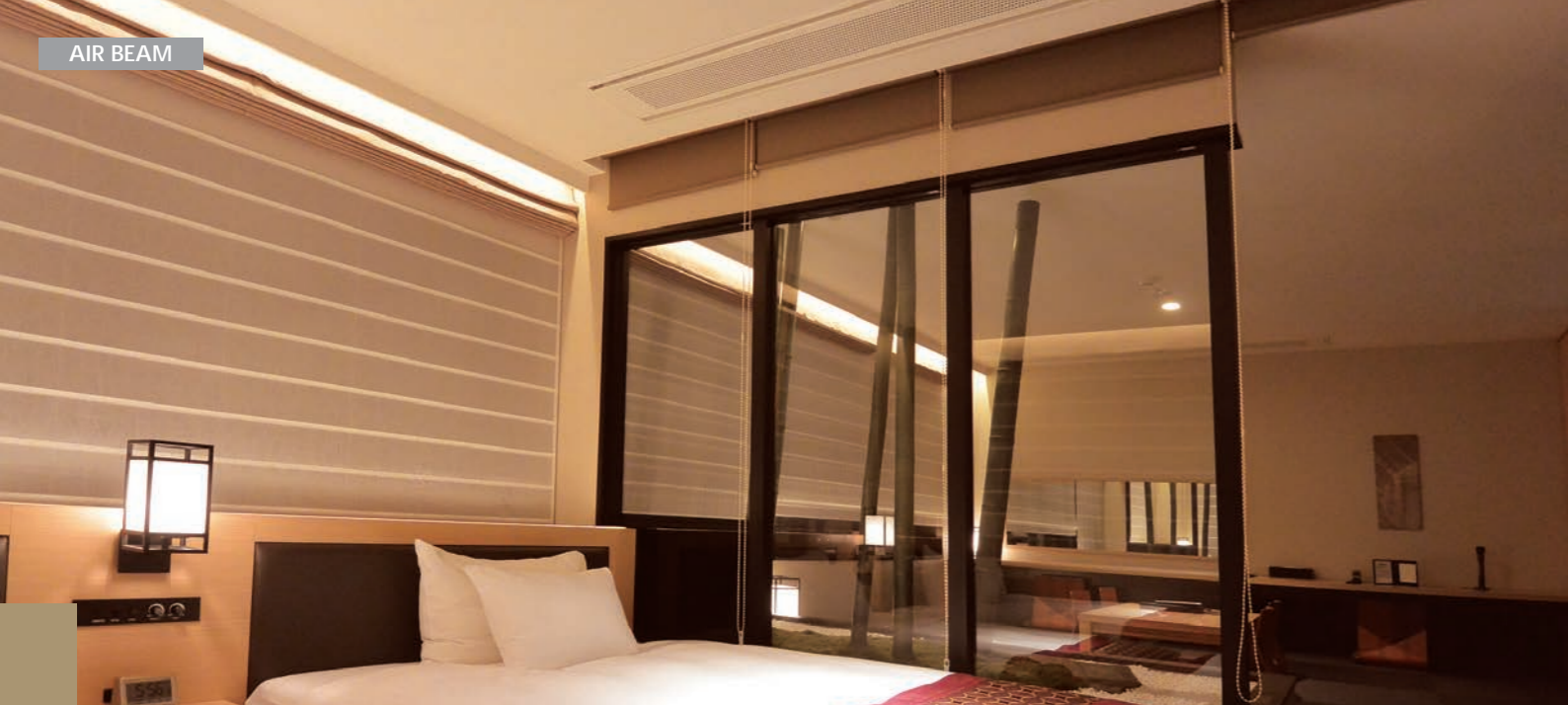
金沢彩の庭ホテル様