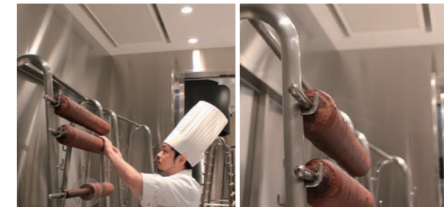
焼き上がったバウムクーヘンにもやさしい空調