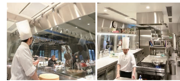
厨房内の外調機吹出口