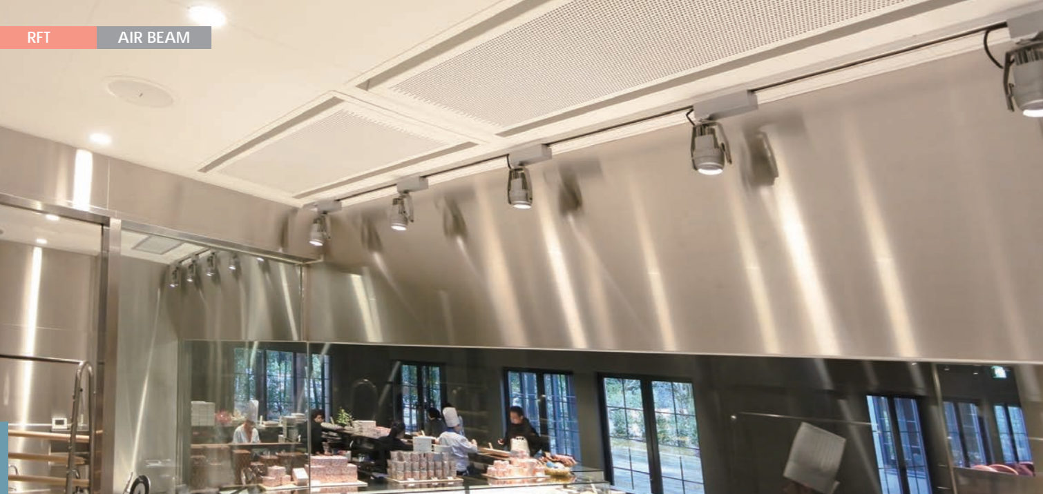
たねやグループクラブハリエ八日市の杜様