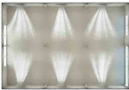
6台設置イメージ図