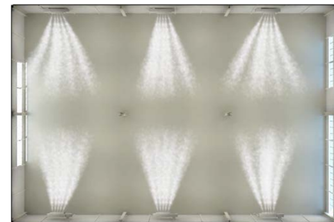
6台設置イメージ図