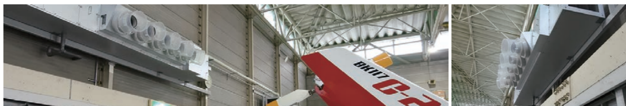
工場用ゾーン空調機(写真左)

格納庫には駐機訓練などで人が集まることもあり、広範囲を空調できるのは社内外から好評とのことでした。