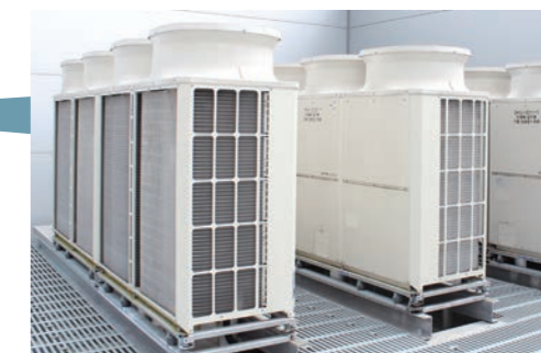
室外機を2台1組で交互デフロスト運転