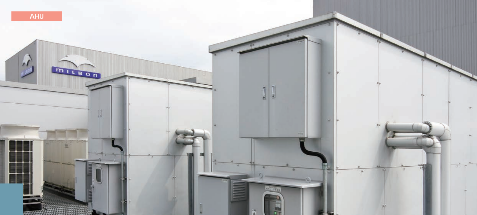
株式会社ミルボン ゆめが丘工場北棟様