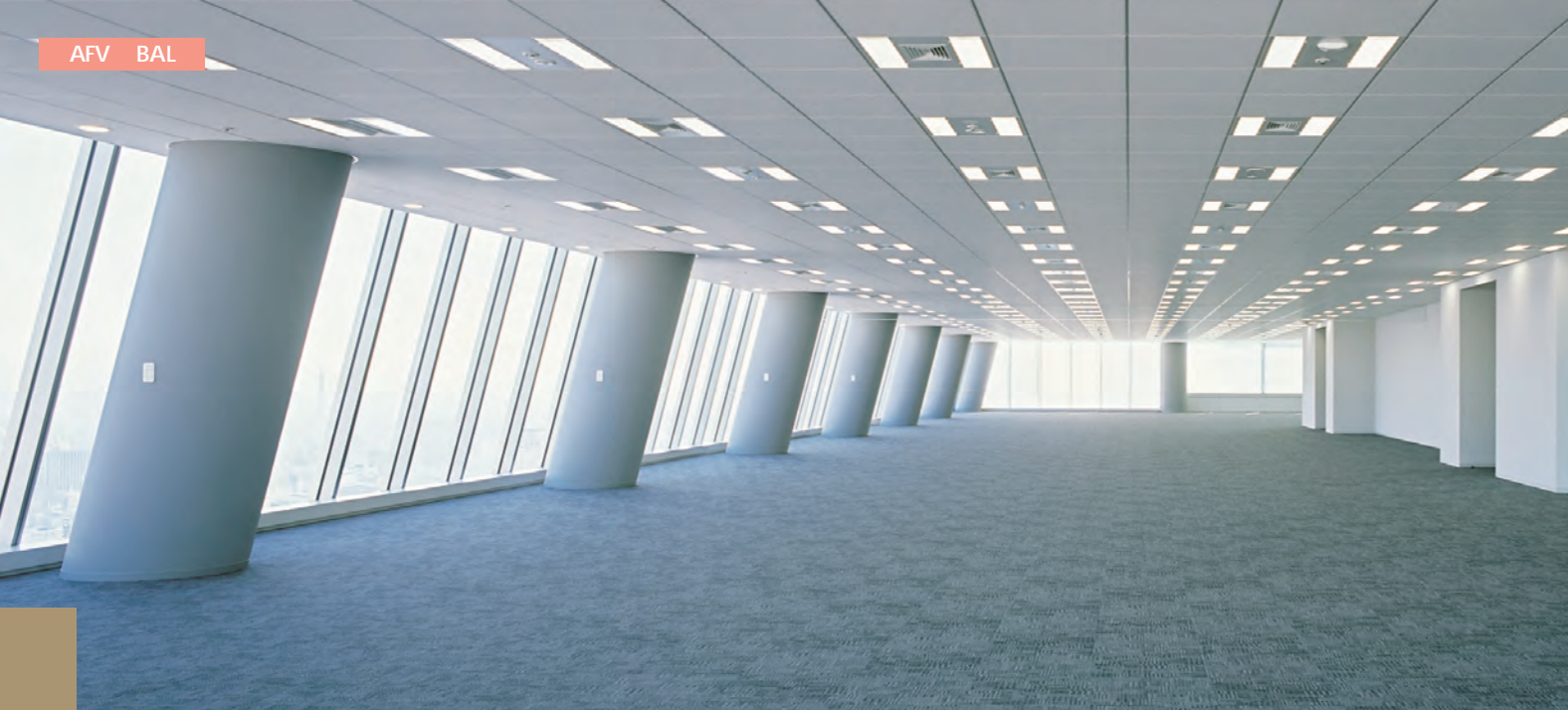
名古屋ルーセントタワー様