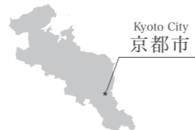
Kyoto City 京都市